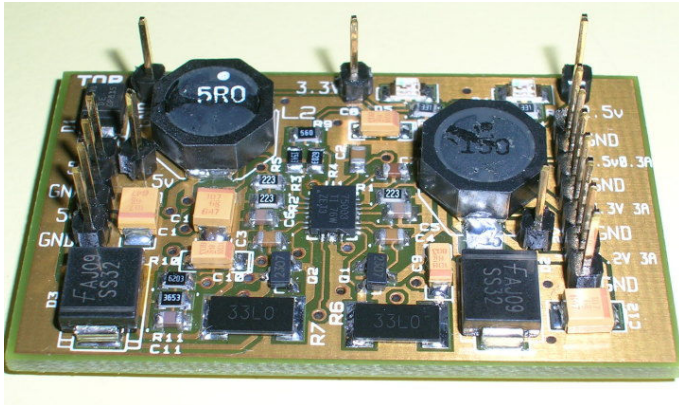
Figura 1. Vista superior del módulo de alimentación (lado componentes).