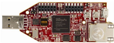
(a) Avnet Spartan-6 LX150T (Xilinx/Avnet)